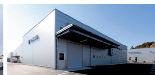
▲池田精工工場棟増築工事