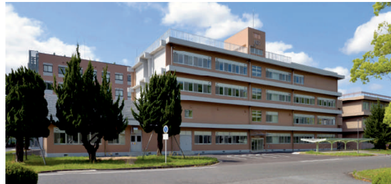
▲岡山大学(津島)総合研究棟改修(理学系)工事