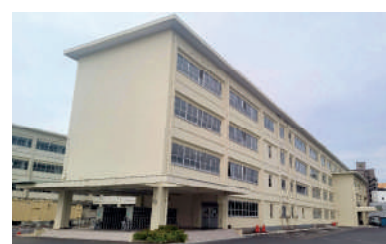
▲県立倉敷商業高校長寿門改修工事