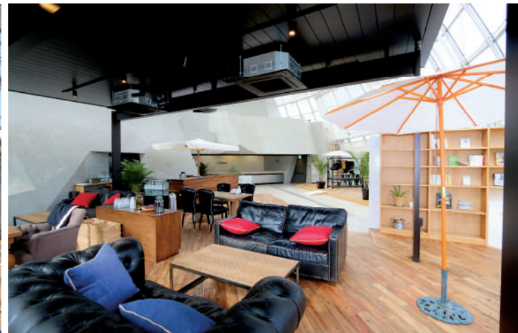
▲オール真庭レストラン・加工棟新築工事