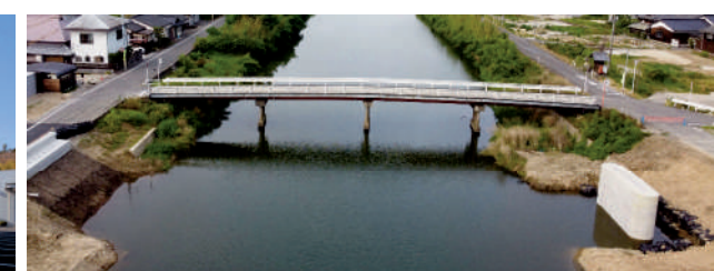
▲公共河川激特工事(堀内橋・坂橋下部工その1)