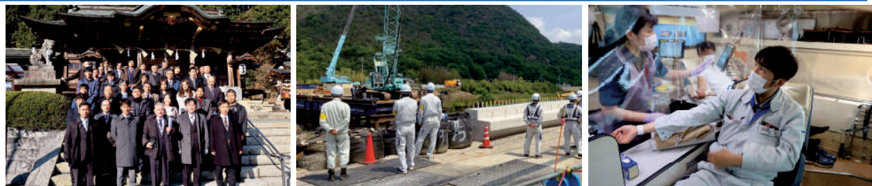
▲木山神社参拝 ▲安全パトロール実施 ▲献血 ▲Globeスポーツドームオープニングセレモニー ▲サマーインターン(学生職場体験) ▲現場見学会